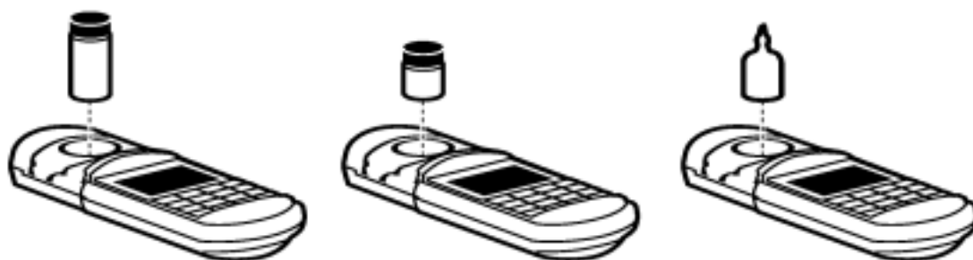
图 5 将样品放入样品池盒中

用不起毛的布或纸巾擦拭样品池,然后将样品池插入样品池盒中,并使菱形标记朝着键盘。